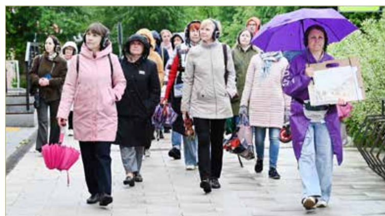
Иммерсивная экскурсия, посвящённая Григорию Штендеру, позволяет взглянуть на город иначе.

Приглашение на познавательную прогулку под названием «Григорий Штендер. Реставрация имени» получили педагоги школ, детских садов, колледжей, а подготовили её учителя и ученики школы № 13.