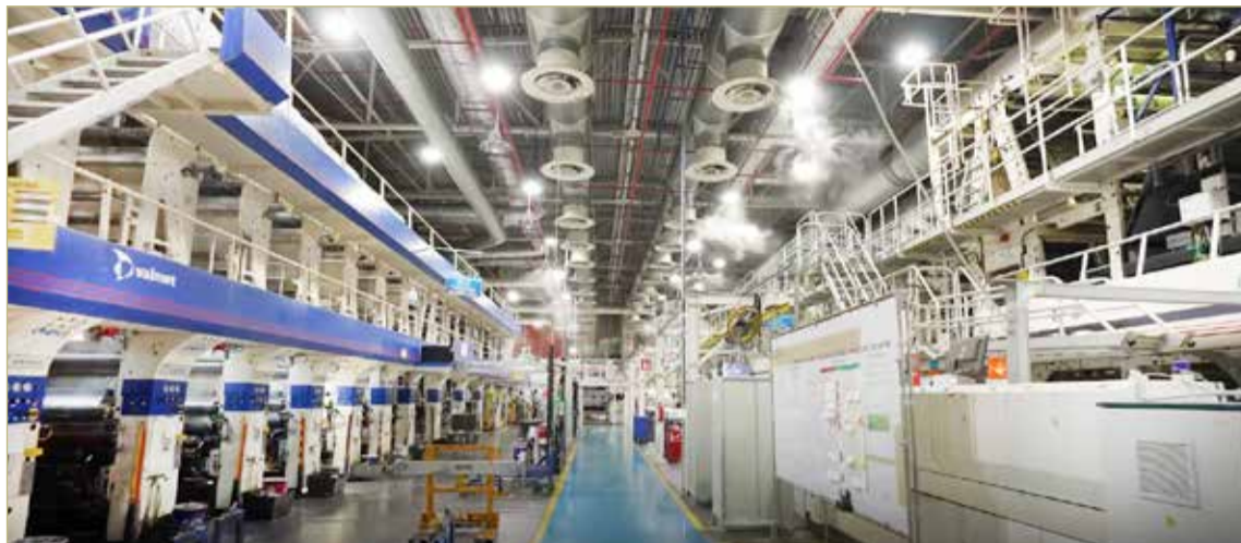
Предприятие «Анима Инфинита Флекс Новгород» планирует расширяться новым корпусом по выпуску гибкой упаковки.

Настоящий этап развития компании начался в 2005 году с основания «Анима Инфинита