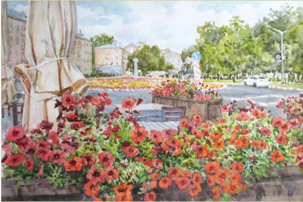
Любимые пейзажи Галины Кижапкиной — с цветами.