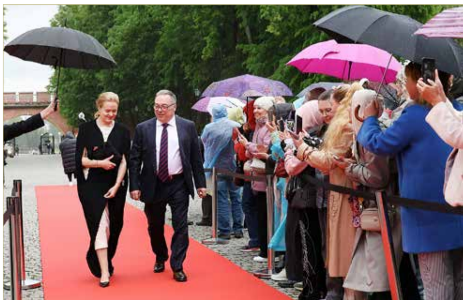
Красная ковровая дорожка в дни фестиваля не пустовала.

Фото пресс-центра правительства Новгородской области и стоп-кадр пресс-службы фестиваля