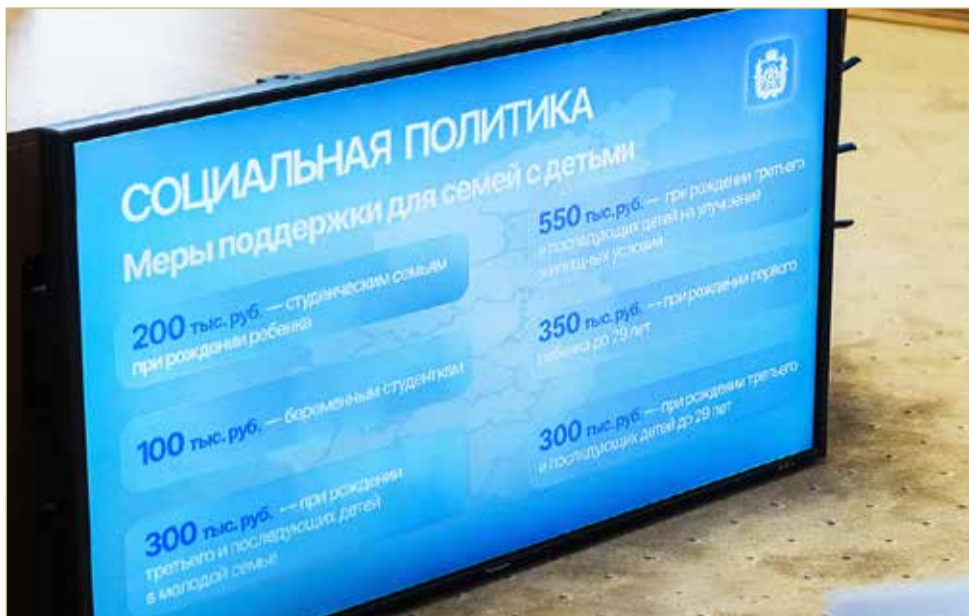
В регионе за год введены шесть дополнительных выплат при рождении детей.

— Новгородская область уверенно входит в топ-25 регионов по качеству образования. Места в рейтингах и победы в конкурсах очень важны для нас, — отме-