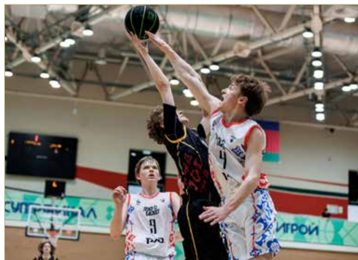
До финального свистка ничего было не ясно, но новгородцы сумели дотерпеть и вновь стали первыми.

Вперёд сборную гнали не только сплочённость и желание защитить титул, но и поддержка болельщиков. Родители баскетболистов проехали почти 2000 километров, чтобы быть рядом в такие важные для них дни, и стать «шестым игроком» в команде. Вторая победа в Краснодаре принадлежит и им.