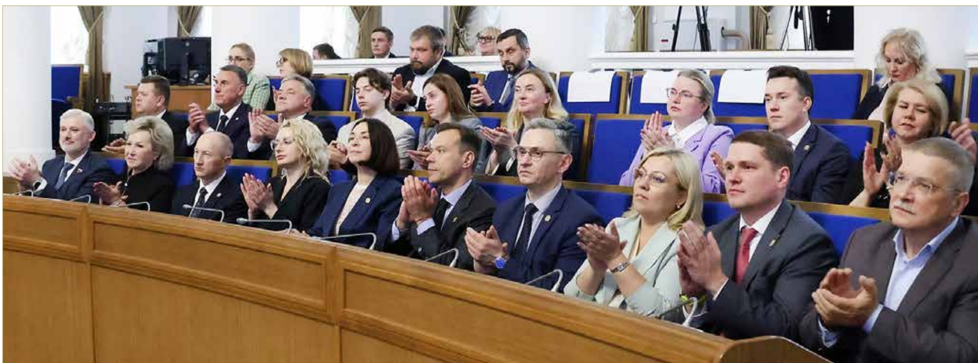
Все достижения области — результат совместной работы жителей, муниципальных команд, правительства региона и депутатов.