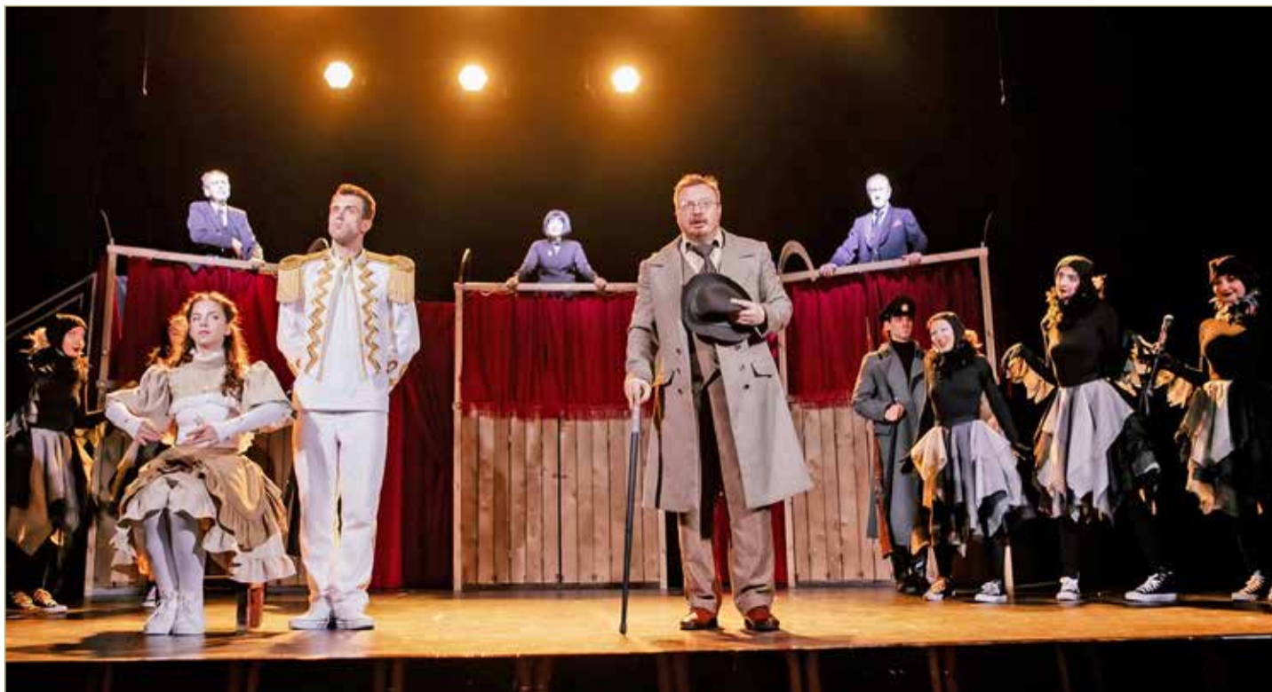
Новый красочный спектакль задаёт зрителю много сложных недетских вопросов.

У нас много массовых сцен. Спектакль как раз начинается с того, что все присутствуют на сцене, перевоплощаются прямо на глазах у зрителя. Много открытых ходов. Мне кажется, что их энергия бьёт в зал и вдавливает в кресло. Кроме того, у некоторых актёров потрясающий комический дар. Когда они импровизировали, просто невозможно было сказать: «Нет, это не нужно!» Всё шло в дело, и получилось здорово.