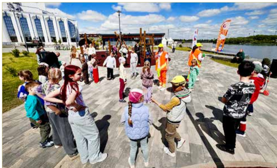
Новгородцев ждут три месяца самых ярких красок и счастливых улыбок.

А когда последние аккорды любимых песен культовой группы смолкли, опустела Софийская площадь, перестали ходить автобусы, на город легла последняя весенняя, почти что белая ночь, чтобы, растворившись в песне соловья, превратиться в то самое, яркое, любимое, горячее наше новгородское лето!