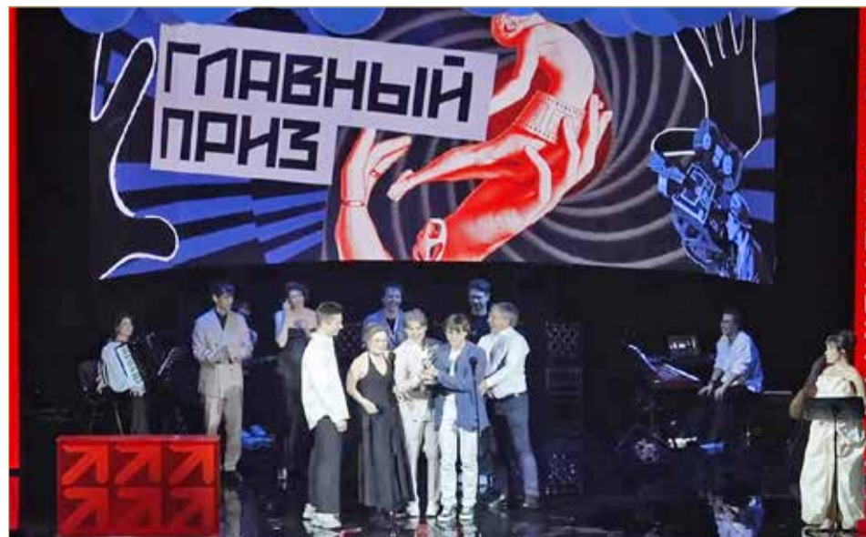
Чтобы сделать фильм-победитель, съёмочной группе пришлось продать автомобиль одного из участников кинопроцесса.