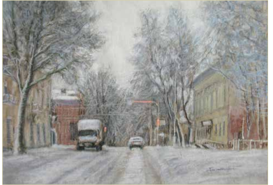
Таким увидела и запечатлела художница посёлок Парфино.