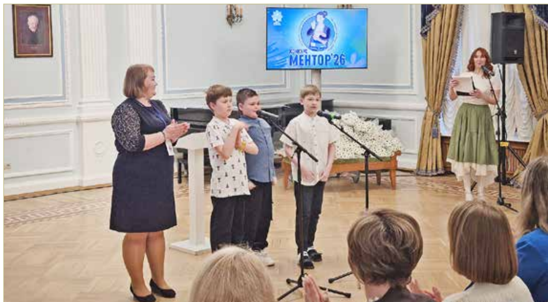
Один из номеров для церемонии конкурса «Ментор» подготовили ученики ресурсных классов.